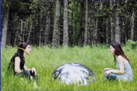
Scenocosme -Grégory Lasserre / Anaïs met den Ancxt