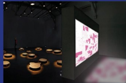
Benjamin Just - Forêt résiliente Installation sonore et Immersive de sculptures Interactives

Comment les artistes s'emparent-ils de ce nouvel espace ? Donner à voir la création d'aujourd'hui c'est ouvrir à une meilleure compréhension des enjeux du monde actuel.