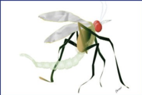
Bernle - graphisme numérique Les effets pervers de l'usage des bombes Insecticides

La technologie numérique n'est pas un « moins » par rapport à la peinture, mais un trait d'union qui offre d'autres univers et d'autres possibilités.