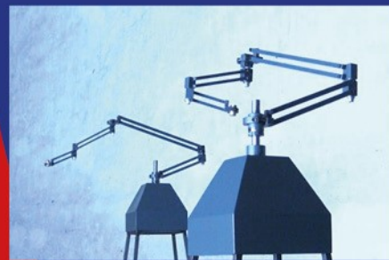
Antoine Blot - Strombo 1-3